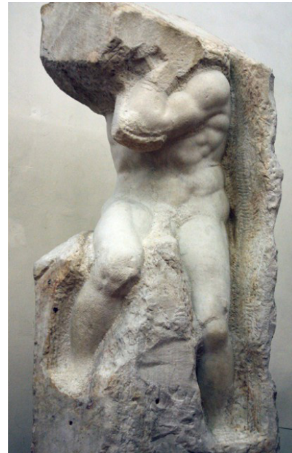
Miguel Ángel, Esclavo (Atlas), 1519-1536

Aunque podría ser revertida al llenar los agujeros y volver al punto de partida.