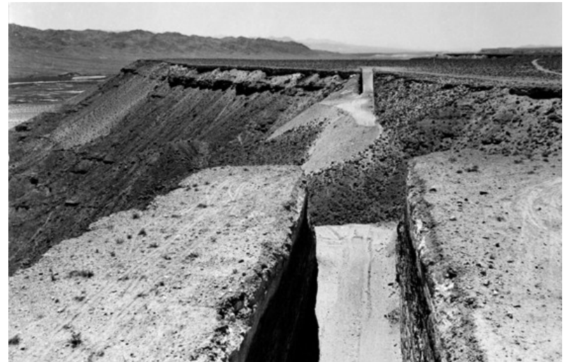
Michael Heizer. Double negative, 1970

Dejar un rastro de espacios negativos, complementarios con el pie de un niño.